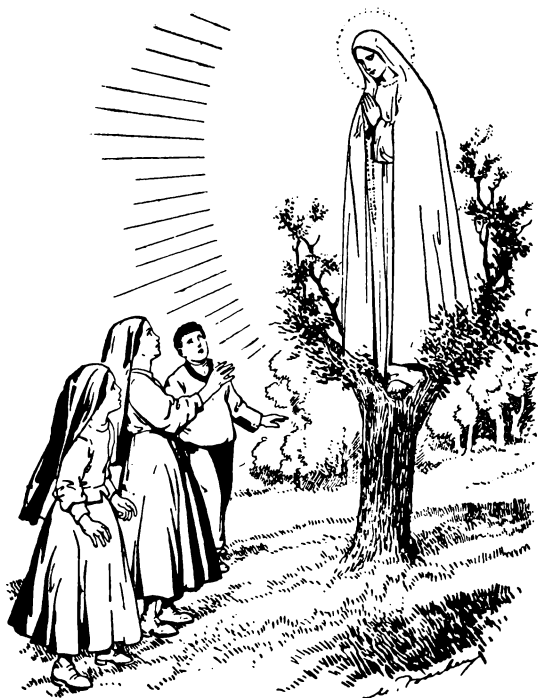
A Szentszűz megjelenik a három pásztor- gyermeknek.