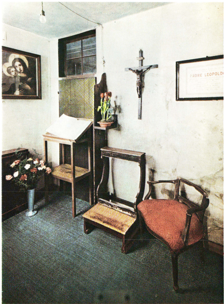
Lipót atya híres, egyszerű gyónatócellája