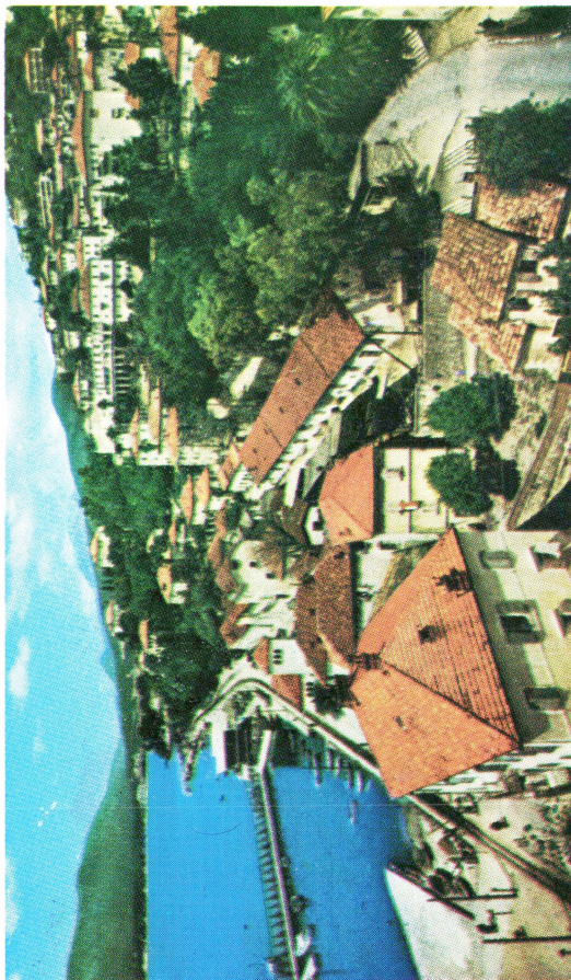
Castelnuovo, Lipót atya szülővárosa