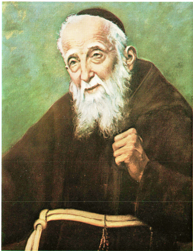
Boldog Mandich Lipót kapucinus atya