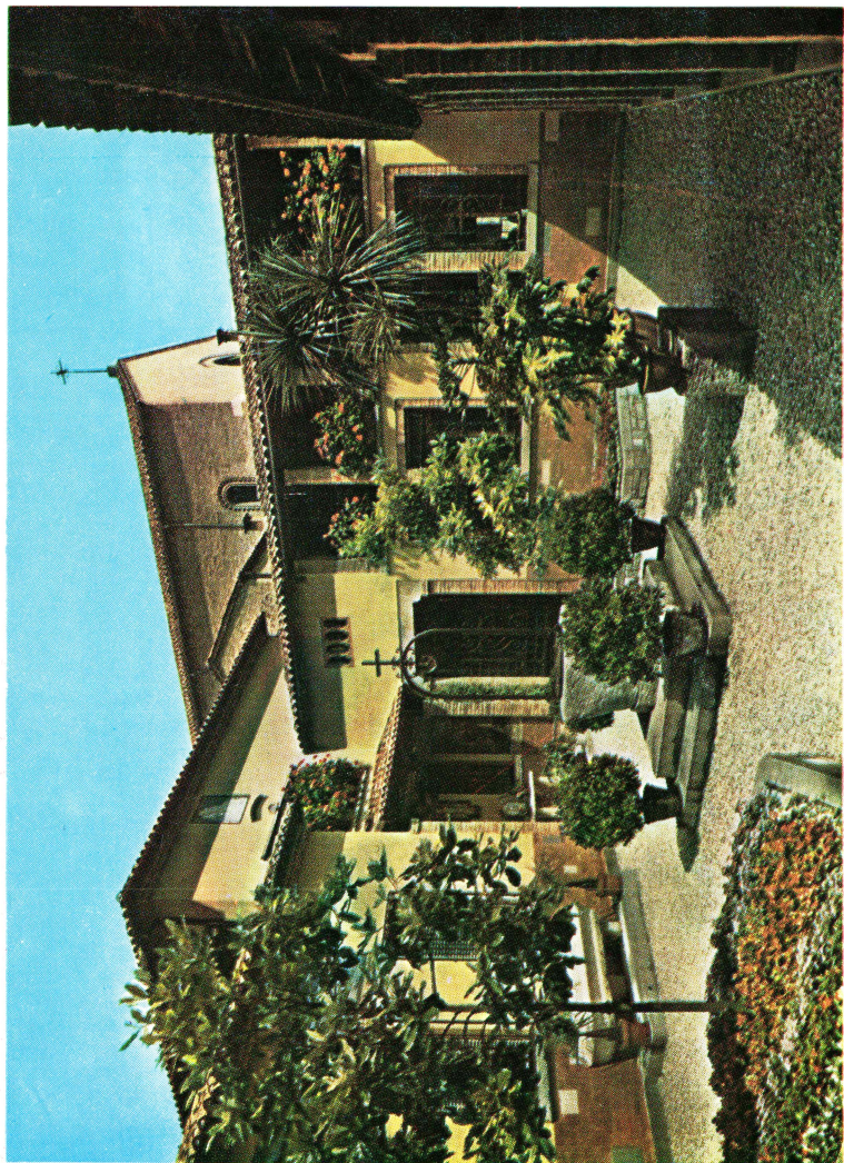
Kolostorkert Lipót atya kedvenc virágaival