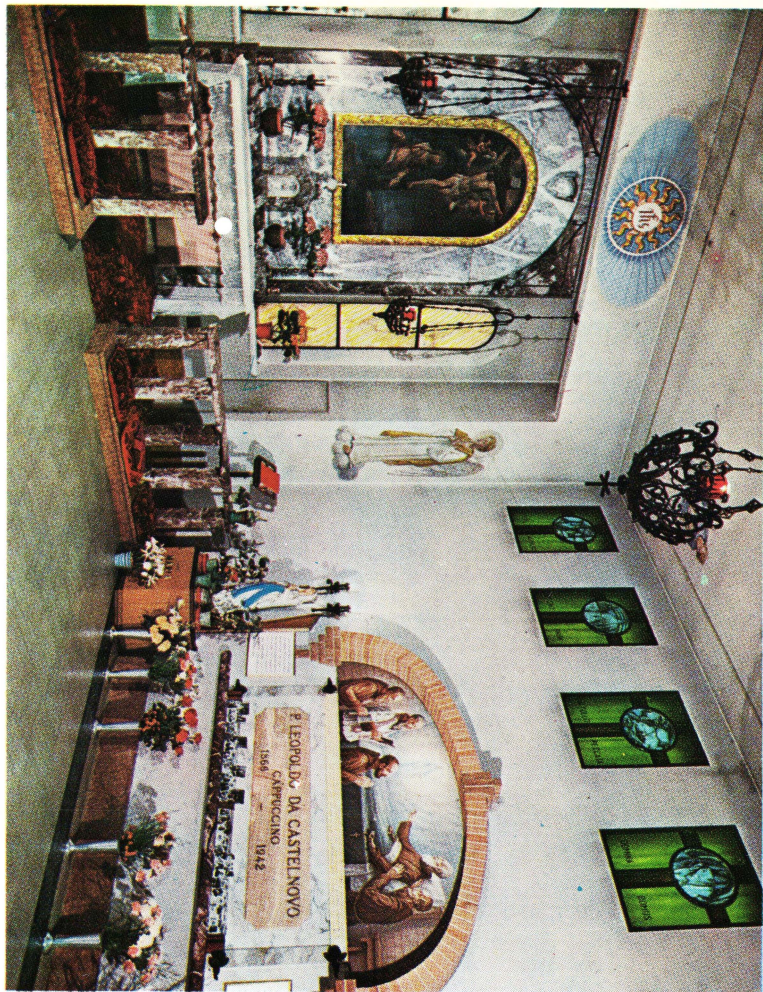
Lipót atya sirkápolnája