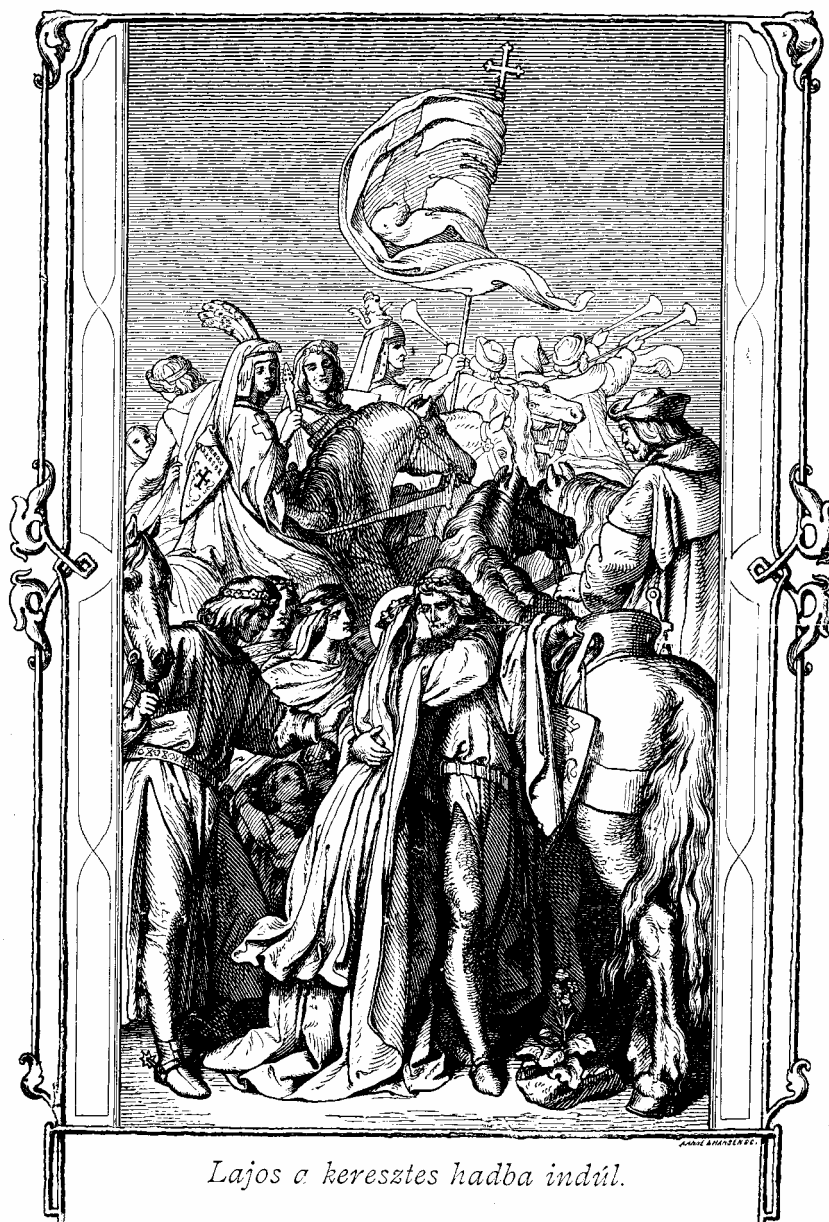
Lajos a kereszties hadba indul.

Ezután kiválogatá azokat, kikre a kormány gondjait bízta, és különösen nejét anyjának, testvéreinek és összes népének oltalmokba ajánlotta. Meglátogatta az Eisenachban levő kolostorokat, és szívélyes búcsút vett azoktól; azután a reinhardsbrunni apátságba ment, s itt, jelen levén az isteni tiszteleten, annak végeztével megölelte az összes jelenvoltakat, és a gyermekeket mind megcsókolá. Könnyek csordultak mindnyájok szemeiből, és maga Lajos, nem tudva leküzdeni bizonyos gyászos előérzetet, könnyezett.