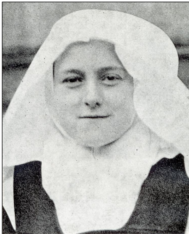
A kármelita újonc, 1889 január