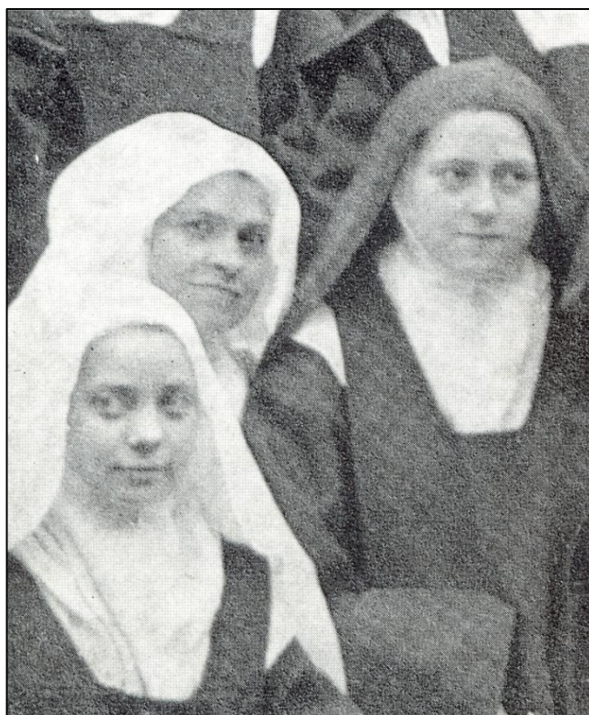
Az újoncmesternő, 1895 április