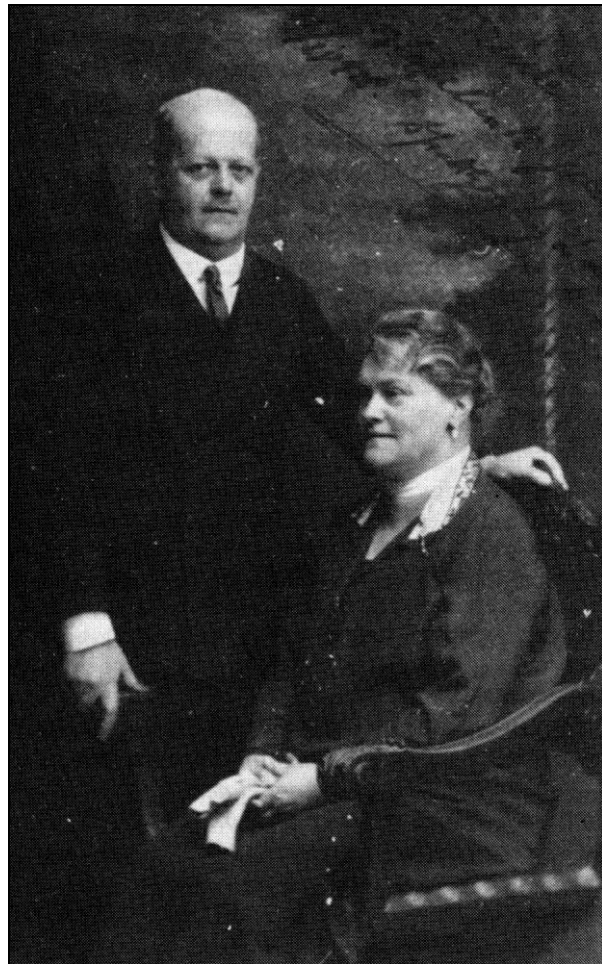
Batthyány-Strattmann László és felesége

Háromnegyed 12-kor mégis mind elmentünk aludni, azért 12-ig még fennmaradtunk. Pontosan 12 órakor letérdeltem és imádkoztam. Mami ugyanezt csinálta, anélkül, hogy tudtam volna.