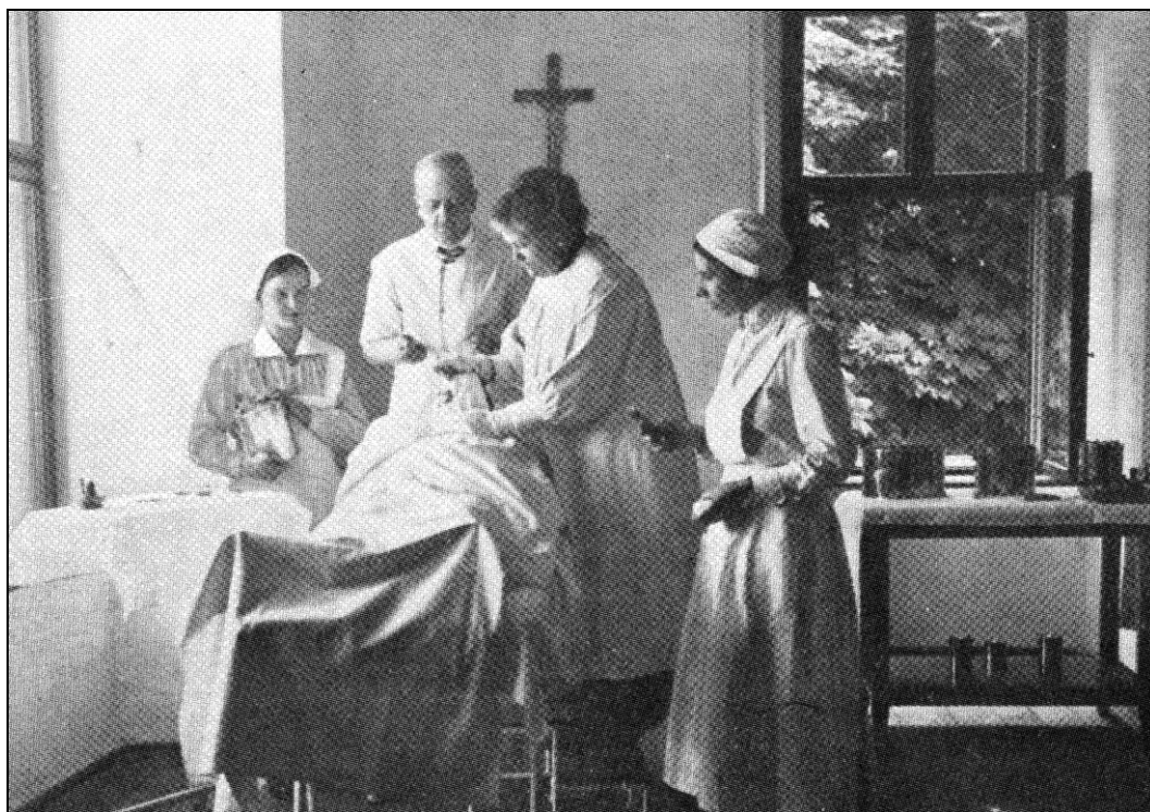
Dr. Batthyány-Strattmann László szemműtétet végez, balján felesége segít

„Fidelitate et caritate” Dr. Batthyány-Strattmann László jelmondata