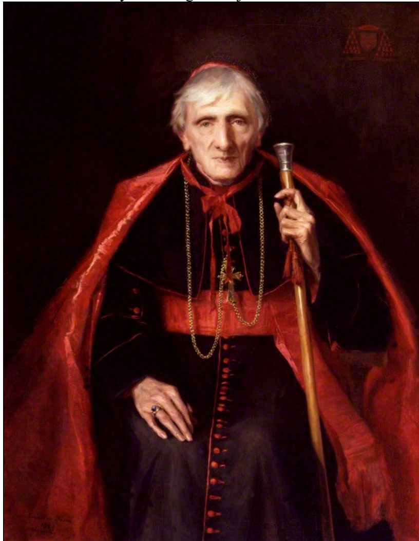
Newman bíboros 1889-ben E. Deane festménye

jelenlétében a szentáldozásban, isteni és emberi hatalmában, melyekben minden jó katolikus részesül és amikről más keresztényeknek alig van sejtelmük”.