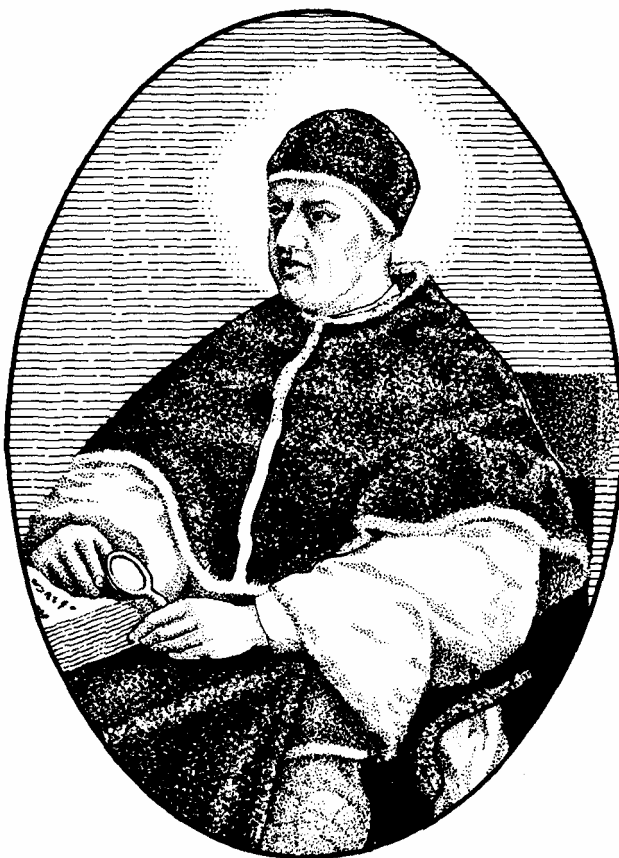
X. Leó pápa