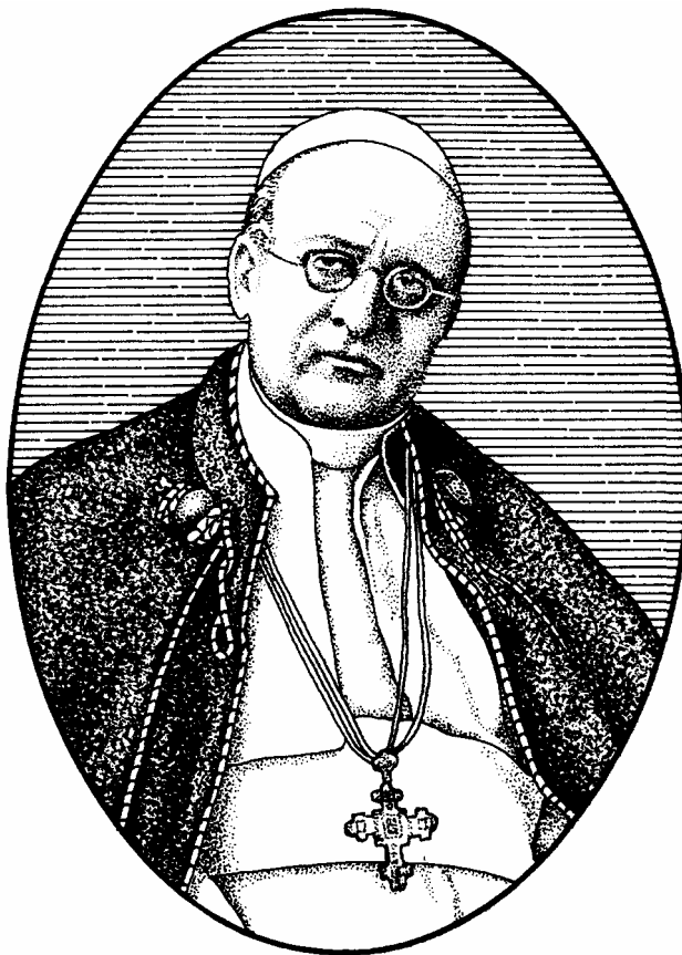
XI. Pius pápa

Mussolini diktátorra. A FUCI tehát belekeveredett a politikai ellenállásba, akkor persze a rajtavesztők oldalán. Erőszakhoz sohasem folyamodott, de nem úgy az ellenfél, a GUF, a fasiszta egyetemi hallgatóság országos szervezete. Feldúlták a klubhelyiséget. Botokkal támadtak a FUCI felvonuló tagjaira, és agyba-főbe verték őket. A szégyenletesen pártoskodó rendőrség tétlenül szemlélte az ilyen eseteket. Megtörtént, hogy az egyik fiatalembernek három helyen is felszakadt a feje bőre, és össze kellett varrni. A reverendás Montinit összevissza lökdösték az ifjú fasiszták, de komoly bántódása sohasem esett. Végül 1931 májusában Mussolini betiltotta a FUCI-klubok működését. XI. Pius nem türtőztette magát tovább. A jogsérelmeket körlevélben tárta ország-világ elé, mégpedig olasz nyelven, hogy otthon is mindenki jól megérthesse („Non abbiamo bisogno ...”, 1931. június 29-én). Mussolini nem csekély huzavona után kijelentette, hogy a Katolikus Akció korlátlanul működhet, minthogy politikai tevékenységet nem folytat. A FUCI tehát ily címen életben maradt, csakhogy például sporttal nem foglalkozhatott, még atlétikával sem. A tagok egyre növekvő számban kezdtek átszivárogni a GUF-ba. Iginò Righetti tehát, az országos elnök, Montininek közvetlen munkatársa jónak látta önként megszüntetni a mozgalmat, és a hűségesnek maradókkal még inkább behúzódni a Katolikus Akció védőszárnya alá. Működési lehetőségnek megmaradt számukra az egyetemi vasárnapi diákmiséje és a diák-hetilap.