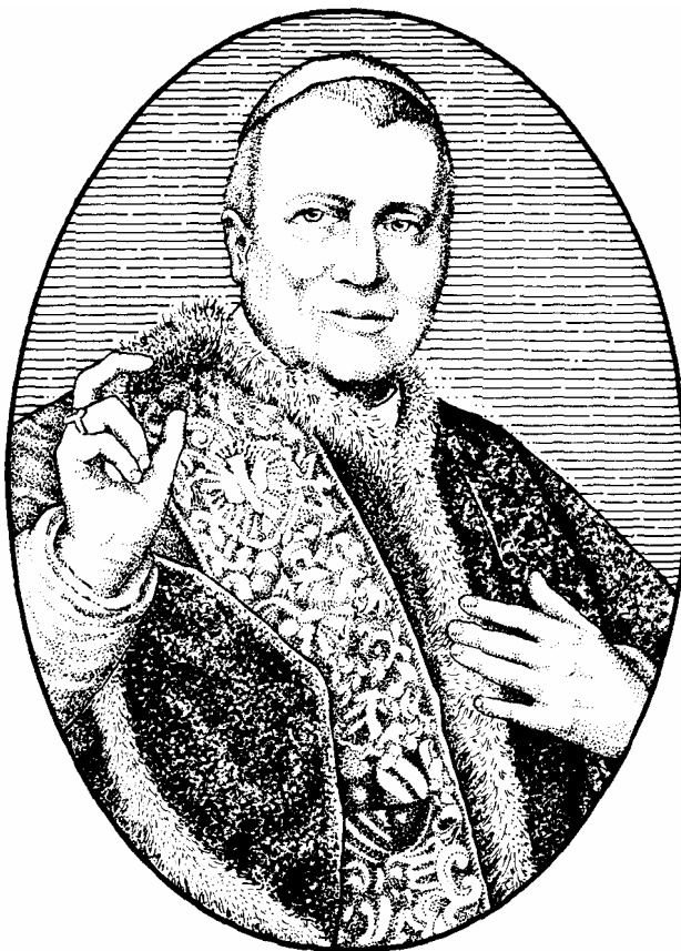
IX. Pius pápa

Az Egyházi Állam utolsó pápa-királya a történelem leghosszabb ideig tartó pápaságával messze meghaladta Péter apostol római tartózkodásának legendás huszonöt évét. Ő lett továbbá az első olyan pápa, akit „látásból” ismerhetett az egész világ, hiszen trónra léptekor már létezett a fényképészet, és élete folyamán hatalmasat fejlődött. Mondhatjuk azt is, hogy IX. Pius a forradalmak korának pápája volt. A bölcsője és a koporsója közti időszakban három forradalom vihara vonult végig Európán. Forradalom elől kellett menekülnie a saját római székvárosából, ami pápai magatartásának fordulópontja lett: a politikai haladás hívéből annak szigorú ellenzőjévé vált. Egy újabb forradalmi fordulat véget is vetett királyságának. A számára idegen állam területén a „Vatikán foglya” maradt haláláig; híveinek adományaiból élt, és szegényen bár, mégis „szellemi és erkölcsi nagyhatalmat” adhatott át utódjának.