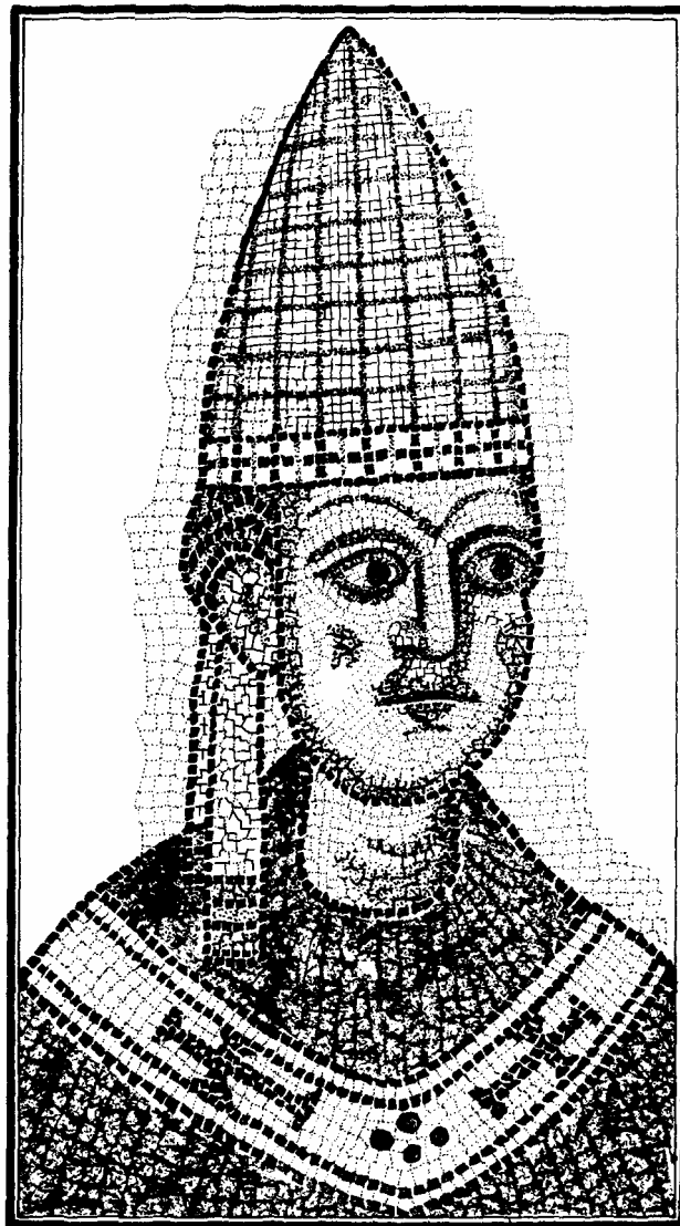
III. Ince pápa

VII. Gergely pápának a pápai hatalom természetéről vallott és tollba mondott elvei – a „Dictatus Papae” – akkoriban, a 11. század vége felé ugyanúgy meghökkentették a kortársakat, ahogyan ma, a 20. század végén is csak fennkölt légváraknak tekinti őket a világ. „Egyedül csak a római főpap nevezhető egyetemesnek ... Egyedül ő használhat császári jelvényeket. Csupán a pápa lábát csókolják az összes fejedelmek ... Szabadságában áll letenni a császárokat ... Fölötte senki sem bíraskodhat ... Feloldhatja az alattvalókat a gonosz uralkodónak fogadott hűség alól.” A szent pápa csak elbukhatott, amikor megkísérelte átültetni elveit a gyakorlatba. Ám az 1200-as századfordulón, a középkor delén sikerült a hihetetlen egy pápának. III. Ince európai értelemben véve a nyugati világ ura lett. Elismerten és csodáltan a történelem legnagyobb pápaegyénisége, bár kifogástalan magánélete ellenére szentként sohasem tisztelték.