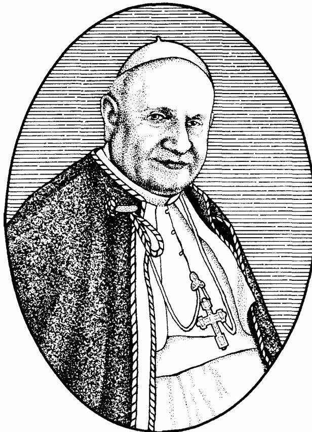
XXIII. János pápa