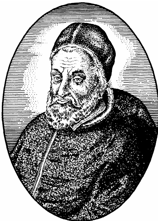
V. Sixtus pápa

Az egyháztörténet legjelesebb építkező pápáját és ugyanakkor a takarékos államháztartás nagymesterét, akinek kezében – amint mondták – „a fából faragott pásztorbot is színarannyá változott”, az evangéliumi szegénység szentjének, Assisi Szent Ferencnek szerzete, a minorita rend emelte ki a névtelenségből a pápakirályok trónjára. Minden valószínűség szerint balkáni szláv vagy albán eredetű volt. Apja a törökök elől menekült át az Adriai-tenger keleti partjáról Itáliába az anconai Márka (örgrófi tartomány) területére. Eredeti családi nevét nem ismerjük; Peretto (ösztöke) az olasz ragadványneve volt; a keresztnéve Piergentile. A felesége cselédasszony egy ottani úrnőnél. Családja minden szegénységük ellenére gyorsan növekedett, és eltartásuk nem csekély fáradságos munkát követelt a bevándorolt földmivestől. Negyedik gyermekének, aki 1521-ben Grottamare községben született, a Felice (Boldog) nevet adta.