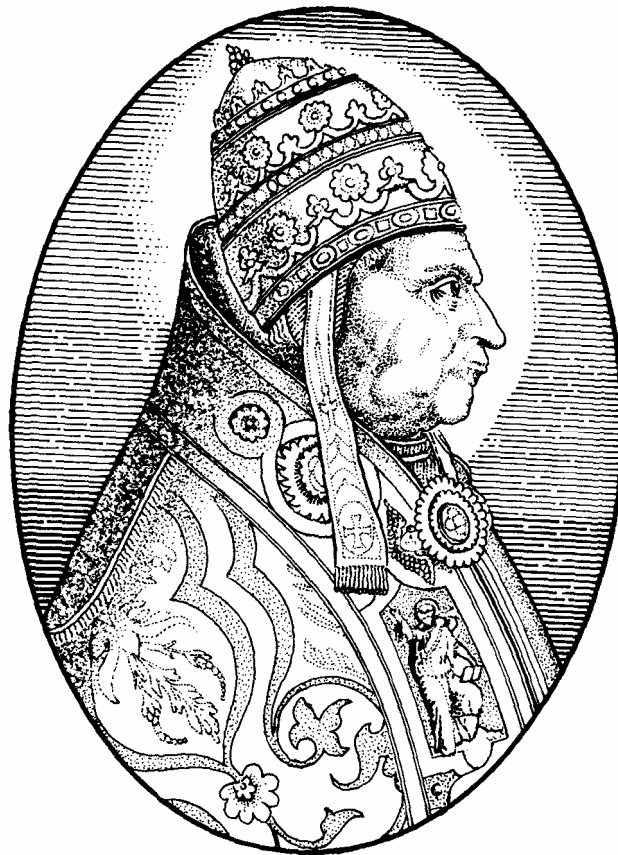
II. Pius pápa