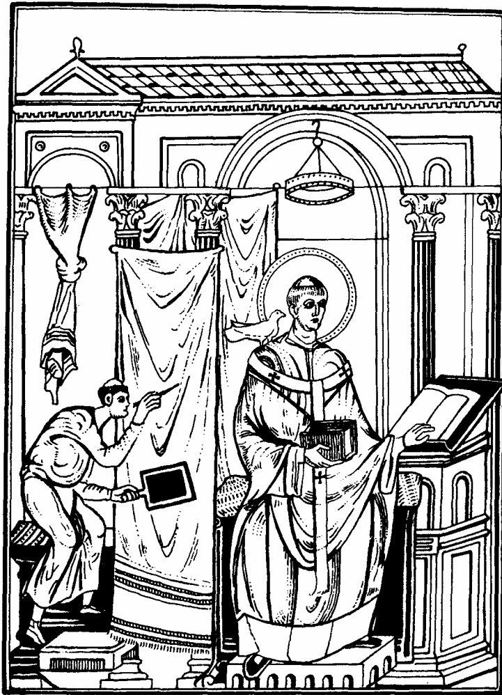
Nagy Szent Gergely pápa és íródeákja

Egyszerre aztán mást gondolt. Elhatározta, hogy visszavonul a világi élettől. Nem papságra gondolt, hanem szerzetessé kívánt válni.