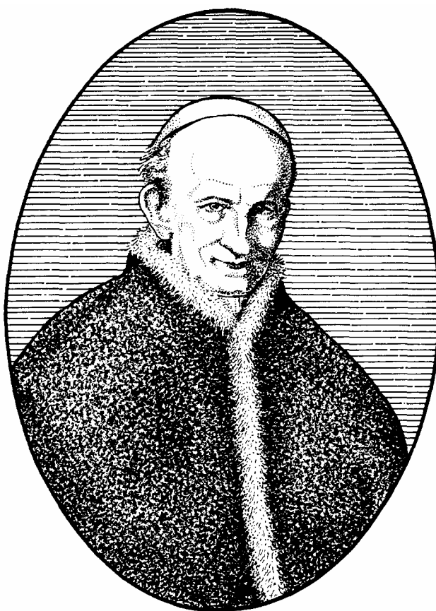
XIII. Leó pápa

A 20. század hajnalát köszöntő pápa a világ köztiszteletét élvező nagy diplomata volt Szent Péter székén. Ország nélküli uralkodó; egyszermind az első a pápák sorában, aki körlevéllel állt az emberi jogait követelő munkásosztály oldalára. Ő lett a keresztény szocialisták és a keresztény demokraták mozgalmának pápája is. Körlevélben kívánta azt is, hogy a bourbon-királypárti vagy a bonapartista-császárpárti francia katolikus tömegek ismerjék el végre-valahára a köztársasági alkotmányt. Keresztény bölcséleti és hittudományos fellendülést is köszönhet neki az egyház, amelynek egy negyedszázadon át volt legfőbb pásztora.