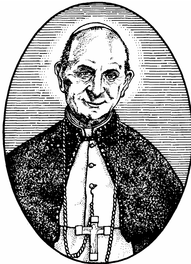
VI. Pál pápa

Évszázadunk észak-olasz pápái közül bátran mondhatjuk a legkorszakalkotóbbnak a bresciai VI. Pált, a második vatikáni egyetemes zsinat pápáját. A katolikus püspököknek ezt a törvényalkotó világkongresszusát még XXIII. János hívta ugyan össze, de a megalkotott tizenhat rendelkezés, határozat és nyilatkozat már a zsinatot folytató és befejező VI. Pál pápasága idején született, és végrehajtásuk is az ő feladata lett.