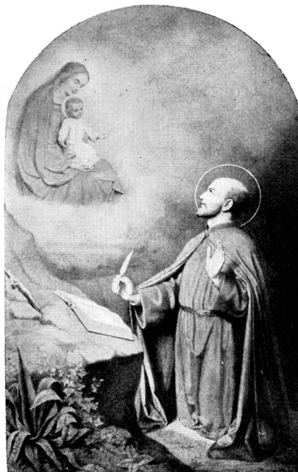
LOYOLAI SZENT IGNÁC

A lelkigyakorlatokat az ebben a könyvecskében található alakban elsőnek Loyolai Szent Ignác végezte a spanyol Manrézában. Amit ott átélt és tapasztalt, azt papírra vetette. Első fogalmazását idővel átsimítgatta, javítgatta és lelkének újabb értékes élményeivel toldotta meg. Így született meg az a kis, de tartalmas könyvecske, amelynek a címe Lelkigyakorlatok , és amely az évezredes keresztény életnek és aszkézisnek új formába való öntése és a gyakorlati életbe új módszerrel való átültetése.