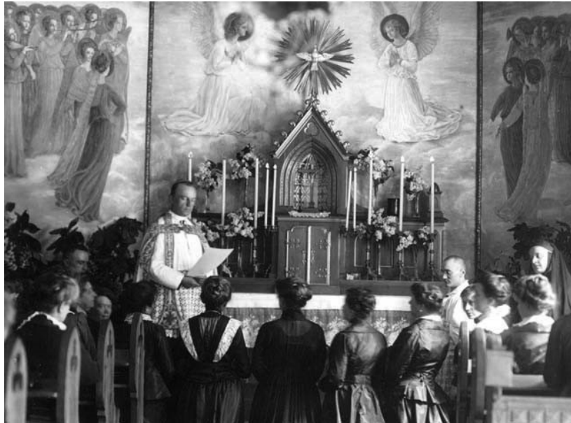
Az 1915. március 28-i konferencián hat kültagnak adja fel a kültagkeresztet.

Még javában dúlt a világháború, mikor Főnökasszonyunknak a kegyelem azt súgta, hogy létesítsen a háború árvái számára hajlékot kegyelmes Püspökatyánk nagy nevével, 60. születésnapjára, meglepetésül, egyházmegyéje területén. A csobánkai misszióstelep azóta egyik legkedvesebb üdülő helye volt.