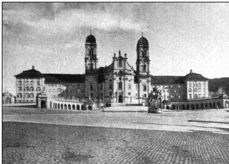
Az Einsiedeln-i búcsújáráróhely

ablakot; de egyáltalán nem bosszankodott, sőt csupa önmegtagadásból még továbbra is nyitva hagyta volna, ha egy testvér ezt észre nem veszi. Egy másik alkalommal éppen az ellenkező eset történt; akkor meg szépen csukva hagyta az ablakot, bár nagyon kellemetlen volt neki étkezésnél a forró, rossz levegőben tartózkodni. Ha az imapadban egyedül volt és akár egy novicius vagy jelölt akart is odamenni, rögtön helyet adott neki, kiment oldalt a szélére, nehogy valamiképpen esetleg – ahogy gondolta – terhére legyen.