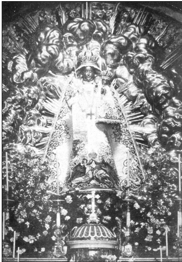
Az Einsiedeln-i Mária-kegykép

A boldoggáavatási eljárás egy bizonyos időpontjában megkívánja az egyházigazgatás a sír megnyitását. Ezen alkalommal gondoskodás is történik arról, hogy a hamvak elő legyenek készítve arra a tiszteletre, melyet az Egyház engedélyez az eljárás szerencsés befejezése után. Az Egyház úgy intézkedik, hogy a megboldogultat az előkészítő eljárás megkezdése után Isten szolgájának lehessen nevezni. Ha meg is indul ezáltal a különös tisztelet, az nincs még megengedve, hogy a jámbor lelket boldog vagy szent tiszteletében részesítsék.