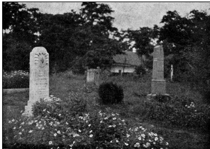
Édesanyánk sírja a rábacsanaki temetőben

Isten elvette az édesanyját és nem adott helyette lelkivezetőt sem melléje ezekben a gyötrő órákban. Köröskörül csak megnemértés vagy rövidlátó aggodás, nem volt senki, aki bölcs tanáccsal állott volna mellette. De akin egyszer megnyugodott az Úr tekintete, azt sötét, göröngyös, elhagyott utakon vezet keresztül. Elrejtí előtte szándékait, de az eseményeket, sokszor még az emberek kicsinyességét és gyarlóságait is felhasználja, hogy tervét megvalósíthassa.