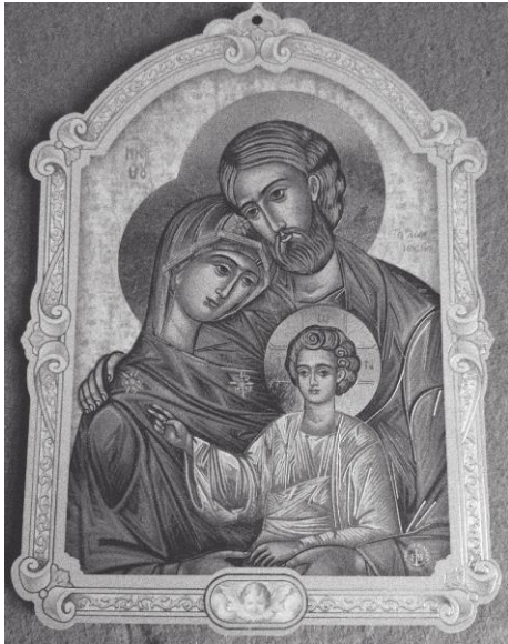
Sacra Famiglia – olasz kegytárgy a 20. századból

Legyen a mi életünkben is úgy, ahogyan a