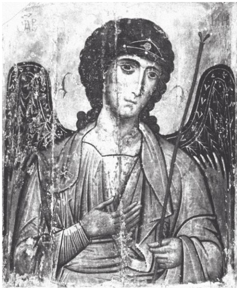
Névtelen festő bizánci ikonja a 13. századból

Szent Mihály arkangyal, védelmezz minket a küzdelemben!