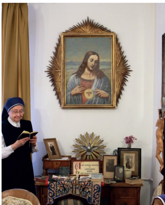
A Szent Szív a dicsőség és öröm fényében