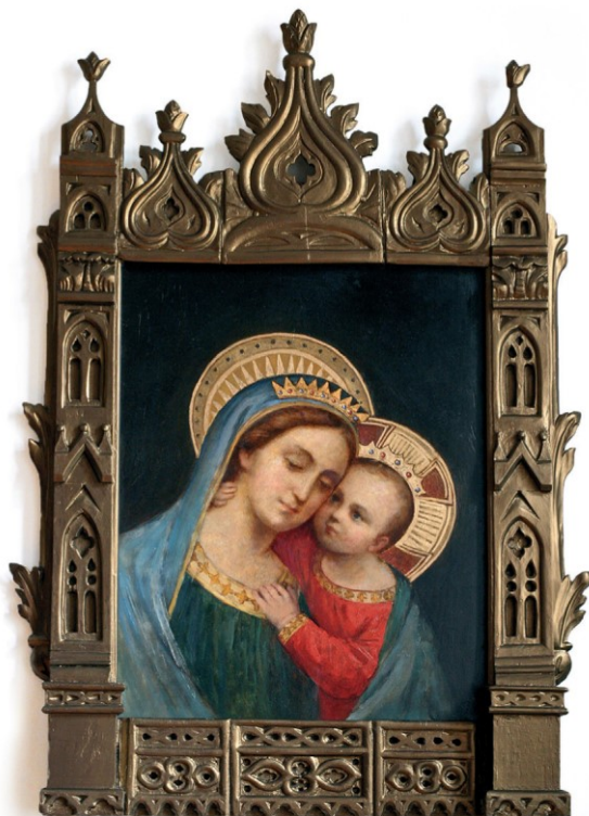
Jó tanács Anyja, könyörögj érettünk!

Számomra világi életemben nagyon fontos volt az a tudat, hogy az eucharisztikus közösség a szentek közössége. Megdicsőült, zarándok és szenvedő egyháztagnak segíthetnek benne egymáson. Ennek csodálatos lehetősége az, hogy a katolikus hívő, aki megfelelően felkészült (megszentelő kegyelem állapota), és teljesítette a kiszabott feltételeket (szentáldozás, mentesség a bocsánatos bűnökhöz való ragaszkodástól, ima a Szentatya szándékára), az egyház segítségével mindössze félórás Szentségimádással akár mindennap megsegíthet egy tisztító tűzben szenvedő lelket a teljes búcsúval járó kegyelemben, vagyis az Isten által már megbocsátott bűnökért eredetileg járó és meghatározott ideig tartó büntetése elengedésében.