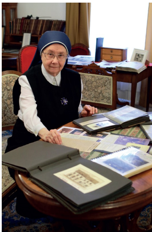
Boldogság? Nyugalom? Sikeres munka?