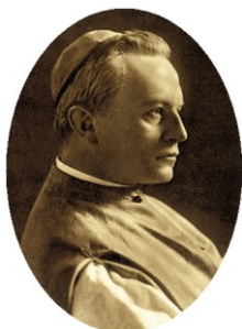
Prohászka Ottokár 1858–1927

Alapítónőnk Farkas Edith volt, akit előkelő családból szólított el az Úr a szegények, a bűnözők, az árvák szolgálatára, a nő-, család- és gyermekvédelem területére. A társulat célja önkéntesek bevonásával annak tudatára ébreszteni a magyar nőket, hogy észre kell venni a társadalmi szinten meglévő nyomort, nélkülözést, a segítségre szorulókat, és tenni kell a hiány ellen. Az elgondolását támogató szociális püspök, Prohászka Ottokár segítségével és első társaival létrehozta a magyarországi, megszentelt életformában élő szociális munkásnők közösségét. Beltagjai elsősorban intézményekhez kötötten tevékenykedtek.