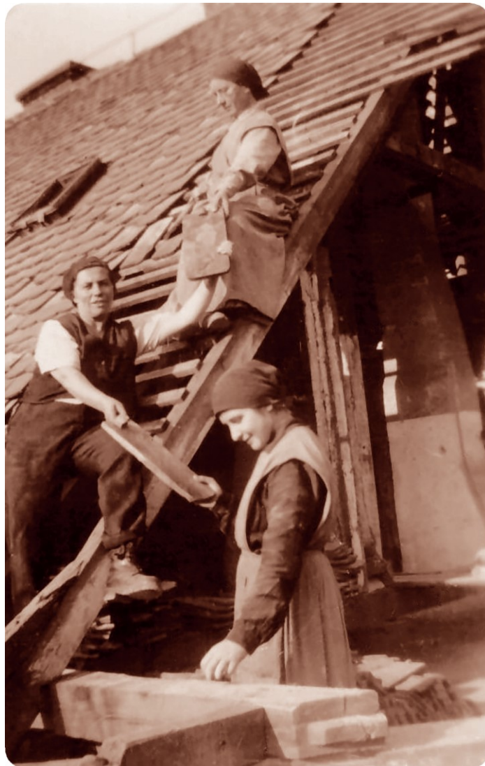
A második világháború utáni rendházújjáépítésben szorgoskodnak a Szociális Missziótársulat nővérei

„Lelkem mécses, tehát világít. Szívem tűzhely, tehát melegít. Jót teszek másokkal, segítve, nemesítve, biztatva hatok rájuk. Aki így él, higgye, hogy ő a világ világossága. Higgye! Krisztus mondta.”