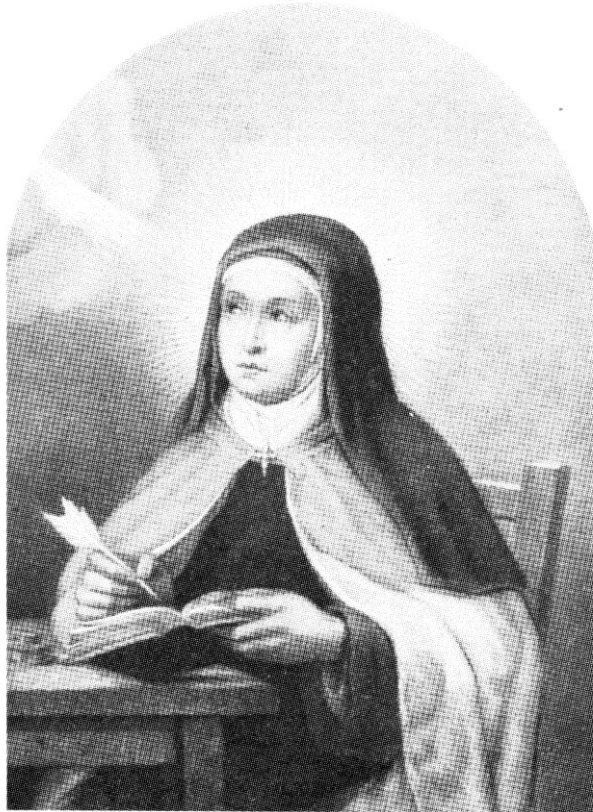
JÉZUSRÓL NEVEZETT SZENT TERÉZIA

Avilai Szent Teréz 1515. március 28-án született, 1536-ban lép be a sarus kármelita nővérek rendjébe, három évi súlyos betegségen esik át, 1553-ban lelki fordulat áll be, 1562-ben megalapítja az első szigorú szabályzatú kolostort, 1566-ban megírja A tökéletesség útját, 1577-ben a Belső várkastélyt. 1582. okt. 4-én este hal meg. 1614-ben V. Pál pápa boldoggá, 1622-ben XV. Gergely pápa szentté avatja. 1626-ban Spanyolország patrónája, 1970. szept. 27-én VI. Pál pápa Sziénai Szent Katalinnal együtt egyháztanítóvá nyilvánítja.