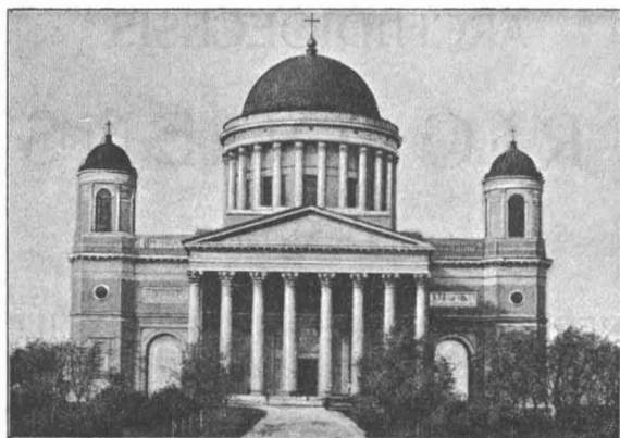
Ecclesia Cathedralis Strigoniensis.