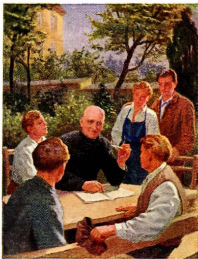
Franz Reich pinx.

Generalat der Kalasantiner Wien XV. Gebrüder Langgasse 7.