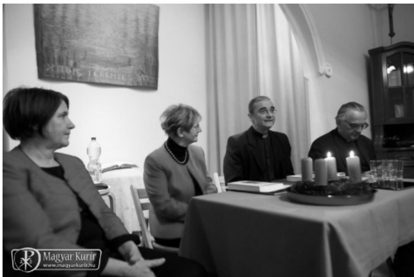
Puskás professzor ismerteti a könyvet

Az ügyvezető elnök megköszönte az anyagi támogatást a társulat tagságának, valamint Semjén Zsoltnak, a nemzetpolitikáért felelős