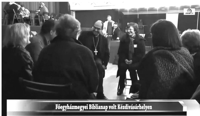
Székely János püspök a résztvevők körében

Valahogyan ugyanígy ezek a biblicsoportok táplálkoznak az élő Isten Igéjéből, abból az Igéből, amivel a Teremtő a világot alkotta.