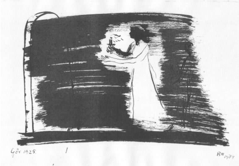
Várákozás – Borsos Miklós rajza

őket a küzdelmes fájdalomtól, és végre békében, örömben élhetnek tovább.