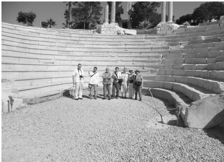
Az alexandriai iskola egyik feltárt előadóterme