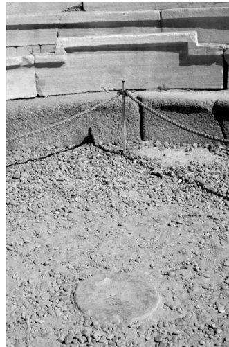
A kerek kő

Az iskola jellegzetessége, hogy a teológiában előtérbe helyezte a megfoghatatlan és megfejthetetlen misztériumot mind a megtestesülés, mind a Szentírás tudományos értelmezésében (később az antiochiai iskola szembeszállt ezzel), amivel együtt járt az aszketikus és dogmatikus spiritualizmus veszélye. Az Órigenész előtti korszakot Alexandriai Kelemen eszménye jellemzi: az erkölcsileg arra felkészülteket a hellén kultúra tudománya alapján akarta elvezetni a keresztény misztériumokhoz, az „igazi tudáshoz”. Órigenész ezzel szemben a sajátosan keresztény valóságot (Egyház, szentségek) állította központba, és tipologizáló szentírás-magyarázatát pontos szövegelemzéssel és történeti háttérrel alapozta meg. Dogmatikája (Peri arkhón) nagyszerű próbálkozás volt, de magában rejtette azokat a tévedéseket, amelyek miatt az iskola később viharos történetet ért (szubordinacionizmus). Ezen iskola és