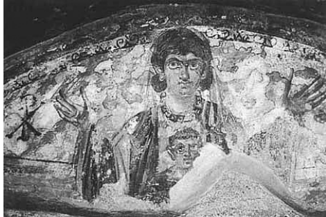
Orante (Római katakomba)

55. Nem tudta (Pál), hogy a harmadik évig való elragadtatása alatt testben volt-e – hogyan van az ember lelke a testben, amikor azt mondják, hogy a test él, de a lelke el van idegenedve a fizikai érzékeléstől, miközben éber, alva vagy eksztázisban van – vagy valójában a testen kívül