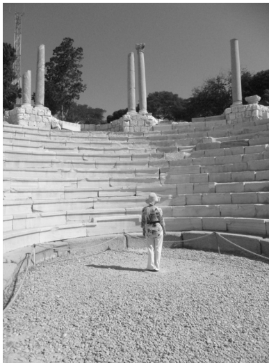
Aki a közepén levő kerek köre állva megszólal, a hangja zeng az egész auditóriumban

A katekéta iskolából egy-egy tudósabb tanító körül kifejlődött egy akadémiaszerű oktatási intézmény, az ún. didaskaleion , ami egy tulajdonképpeni teológiai