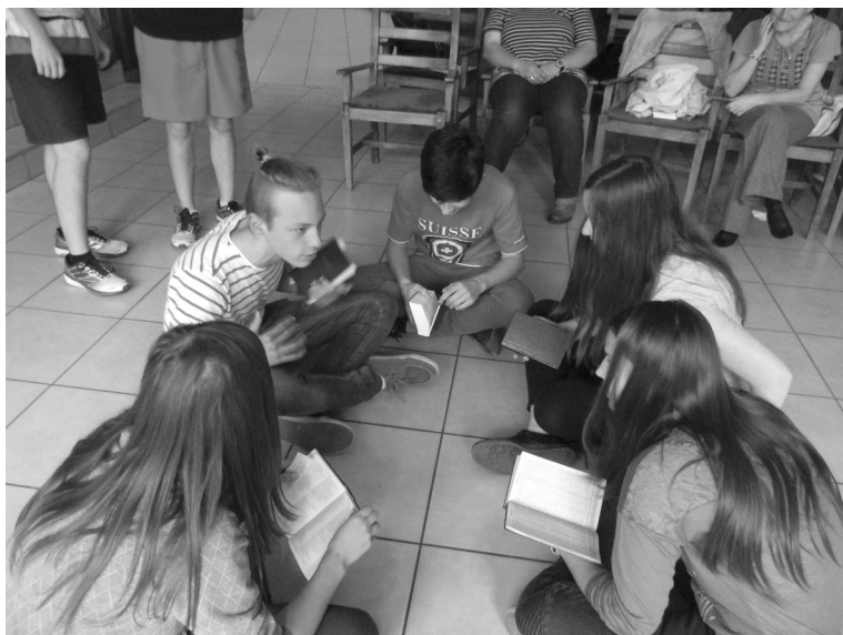
Erdélyi fiatalok a Bibliai Alapkurzuson

olvasásával kapcsolatosan. Olyan gondolatok hangzottak el, mint: „Olvasd és éld!” , vagy „A Bibliát nyitott szívvel, imádkozva kell olvasni!”, „A Biblia Isten Igéje emberi szavakkal.” „Isten a felhők- ből nem volt mit kezdjen az emberrel. Hogy az emberrel szóba tud- jon állni, emberré kellett lennie.” „A Szentírás nem ismerése, Krisz- tus nem ismerése. A Szentírás megismerése, Krisztus megismerése.” „A Szentírás mindig, de mindig aktuális.”