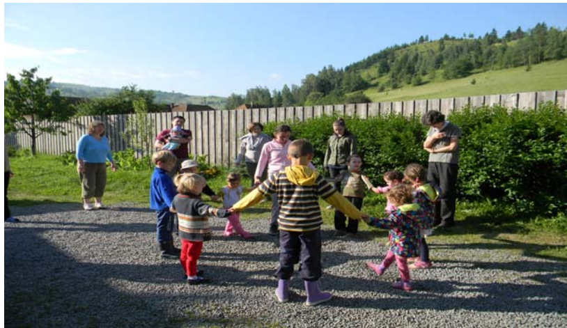
Játék az erdélyi ifjúsági bibliatárborban