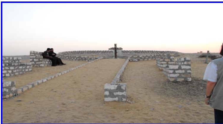
Matta el Meszkín sírja az egyiptomi Makariosz kolostor mellett

19. Az ima felsőbbrendű tett, amely minden erény fölött áll. (Szír vagy Ninivei Szent Izsák, uo. I,2,44.)