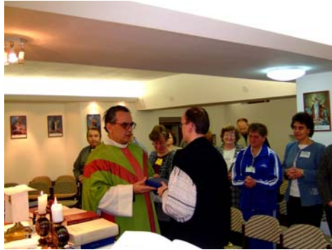
Bibliák megáldása, átadása

Szent Jeromos Katolikus Bibliatársulat továbbképzési munkacsoportja 1992-ben, tehát ugyancsak 23 évvel ezelőtt kezdte meg bibliaapostolképző szemináriumok szervezését és megtartását. Hazánk számos városában és egyházmegyéjében, valamint Kárpátalján, Erdélyben és a Vajdaságban tartottunk