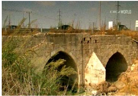
Bájbár hídja Izraelben

1265 tavaszán Bájbár kimaszírozott Egyiptomból. Eredetileg az volt a célja, hogy átcsoportosítja seregeit a szíriai határhoz, mert a mongolok megint betörni készülnek, de erre nem került sor. Ha viszont csapatait már összetoborozta, szép csendben a keresztés államok ellen indult. Erre az időre a keresztények alaposan meggyen-