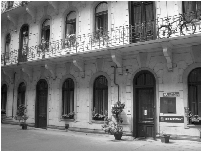
Bibliaközpont (Társulatunk székhelye Budapesten)

Igen jelentős Jézusnak a 9. versben olvasható mondása: „Ma üdvösség köszöntött erre a házra, hiszen ő is Ábrahám fia.” A 6. versben fellelhető párhuzam alapján – „Ma a te házában kell megszállnom” – nem kétséges, hogy az üdvösség alapvetően Jézus jelenlétével azonos. A 9. vers mondata válasz mind a néptömeg zúgolódására („Bűnös emberhez tért be” 7. vers), mind pedig Zakeus ígéretére (8. v.). Nyilvánvalóvá válik: Zakeus megtérése nem más, mint teljes megnyílás annak az üdvösségnek, amely Jézus Krisztusban konkrétan jelenvalóvá és tapasztalhatóvá válik. Zakeus megtérése ugyanakkor újabb példa arra, mit is jelent „Isten előtt gazdaggá” válni (vö. 12,21).