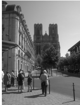
A Reims-i székesegyház