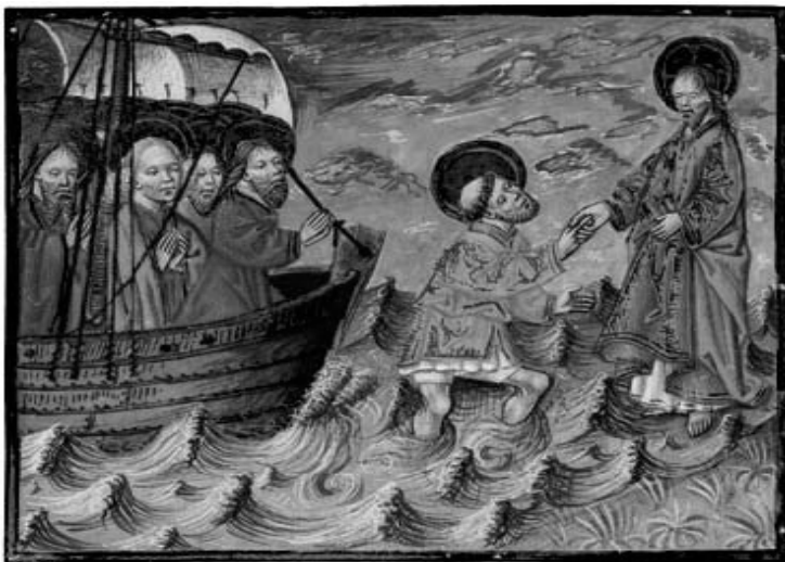
Jézus kimentí Pétert a vízből (Bécsi Arany Biblia)

Hogy milyen konkrét alakot ölt a krisztushívők apostolkodása a világban, az a világ hozzájuk való viszonyulásán is múlik. Egy vésszes feledékenységre süllyedő világban az alapigazságok és erkölcsi értékek átmentőiként tevékenykednek; egy ellenséges érzületű és támadó szellemben fellépő világban a végső igazságok és alapvető értékek védelmezői lesznek; egy hanyatló és széteső társadalmi-kulturális környezetben elsődleges feladatuk egy evangéliumi szellemű kontraszt-társadalom megjelenítése az egyházban, mely a gyógyulás, az erő és a remény forrása lehet mindenki számára; egy jóakarató és a maradandó emberi értékek mellett elkötelezett társadalmi-kulturális közegben a cselekvő együttműködés és kezdeményezés apostolai lehetnek.