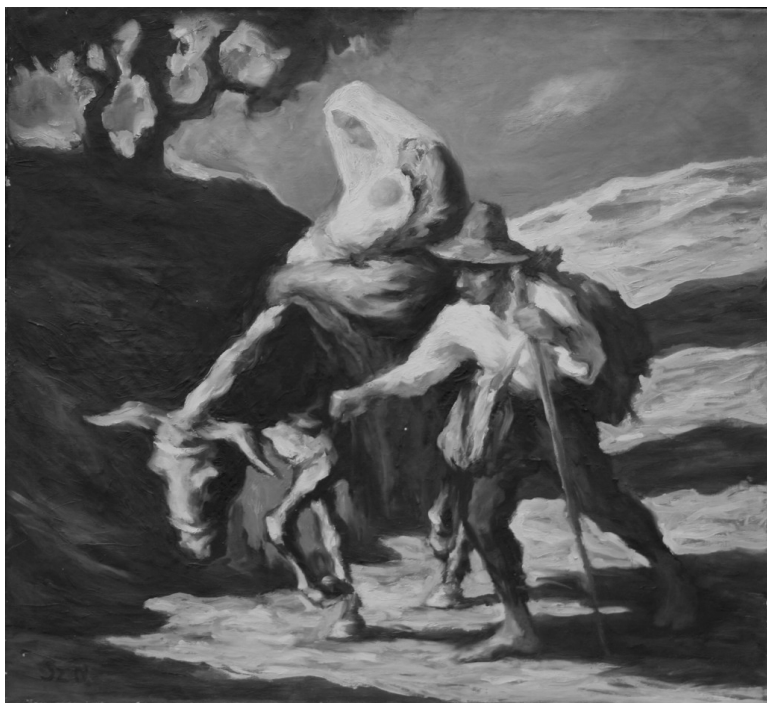
Szűdy Nándor: A család visszatér