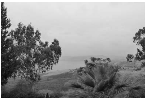
A Genezáreti tó

Mindenekelőtt arra figyelhetünk fel, hogy Pál az Engesztelés napjának szertartására utalva (Róm 3,25) Krisztus halálát engesztelő áldozatként értelmezi, amelynek eredményeképpen Isten végérvényesen kiengesztelődött a bűnös emberiséggel. Ez nemcsak a bűnök bo-