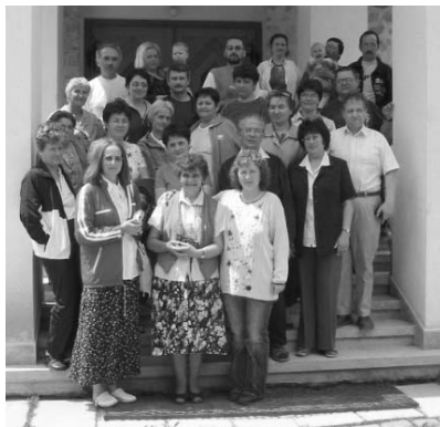
Korábbi képzés résztvevői

– Szeptember 26-án, szombaton 5 órától Marosvásárhelyen a Bibliaközpontban évyító lesz bibliacsoportok vezetőinek és tagjainak.