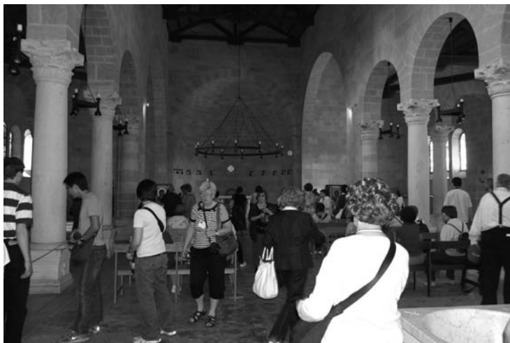
Kenyérszaporítás temploma – templombelső

ten országához való hasonlítás [beleértve a kertész, illetve az aszszony munkáját és az időt is] (Mt 13,31 ill.33 és Lk 13,19 ill. 21) nyújtja a tökéletes magyarázatot, a hasonlat teljesebb megértését. – William M.Wright a János-evangélium Júdás-képét és a görög-római jellemábrázolást állítja egymás mellé. Egyes szakértők úgy érvelnek, hogy az evangélium nem mond ki Júdásról végleges ítéletet; azt Istenre hagyja. A cikk sorra veszi a 6 (különböző hosszúságú) szövegrészt, amelyekben Júdás szerepel, mindegyikben bűnösként, és egyre fokozódó mértékben! Ha mond valamit, hazudik; ha tesz valamit, az szégyenletes. Hűtlen tanítvány, aki elárulja, halálra adja mesterét. Ez határozza meg a jellemét! – Peter Spitaler a Jakab levél 1,5-8 szakaszát magyarázza, de nem akarja alapul venni a »kétkedés« későbbi leggyakoribb jelentését, sem a nem-bibliai szövegek személyek közti vitáinak érveit. Ehelyett, – bár a levél később számos tanácsot ad a személyek közti különbségek eseteire, – meg akar maradni az önmagukban állhatatlan, »kettőslelkű« olvasók vagy hallgatók körére alkalmazható hullámmzó tenger hasonlatánál.