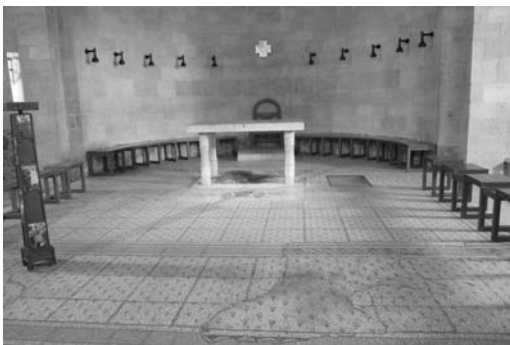
A megjelenés temploma – templombelső

Részesedés Krisztus papságából – Krisztus főpapságával szorosan összefügg az őt követők papsága. Igaz, a hiereusz szó, illetve a vele rokon kifejezések nem szerepelnek a keresztényekkel kapcsolatban, ám a levél több kijelentése is azt mutatja, hogy Krisztus áldozata nemcsak megtisztította a hívőket, hanem papi jelleggel is felruházta őket. A szerző az Engesztelés napjának szertartására hivatkozva szól arról, hogy vére, azaz élete feláldozása által Krisztus egyszer s mindenkorra bement a szentélybe (9,11-12) – szemben a zsidó főpapokkal, akik csak évente egyszer, rövid időre tehették ezt meg. Krisztus bemenetele egyúttal a hívők számára is szabad utat nyitott a szentélybe: „Testvérek, Krisztus vére által teljes bizonyosságunk van arról, hogy beléphetünk a szentélybe, amelyet nekünk mint új és élő utat a függönyön azaz a saját testén keresztül megnyitott” (10,19-20; vö. még 7,25). Ami az Ószövetségben a főpap kiváltsága volt, az most minden keresztény természetes joga.