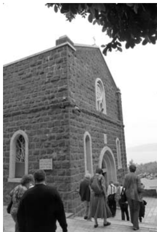
A megjelenés temploma (Jn 21)

Az előzőek kiegészítéseként a Filipieknek írt levél egyik érdekes mondatára is kitérhetünk: „Sőt, ha a hitetek áldozatán és szolgálatán felül még véretem is kiontják italáldozatul, örülök és együtt örvendezem mindnyájatokkal” (Fil 2,17). Bár Pál szolgálatának papi jellege nem jelenik meg oly egyértelműen, mint a Római levélben, 9 az mégis jól látható, hogy az apostol egész életének, minden tevékenységének egyetlen célja van, nevezetesen a keresztyén testvérek hitének az erősítése, s ezzel a személyes áldozatuk elősegítése. Az esetleges vértanúhalál mint italáldozat ezt a szolgálatot koronázza meg. 10 A mondatban valószínűleg arra a szokásra történik utalás, hogy az italáldozatot az ételáldozatra öntötték rá. A Róm 15,16 fényében a szóban forgó kijelentés azt is sejteti, hogy az apostol, miközben a krisztushívőket papként szolgálja és életáldozatukat lehetővé teszi, saját maga is Istennek tetsző áldozattá válik.