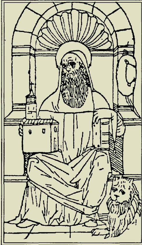
Szent Jeromos, Társulatunk védőszentje