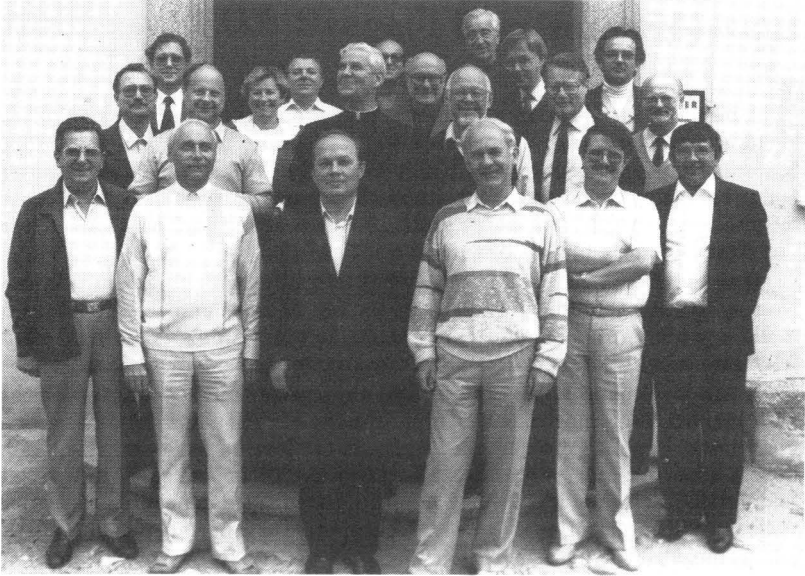
A Középeurópai Bibliaszervezetek Munkacsoportja 1987-ben

„Biblia Tervcsoport” néven egyesület is alakult, amely jelenleg főként a európai biblikus pasztoráció segítésével foglalkozik.