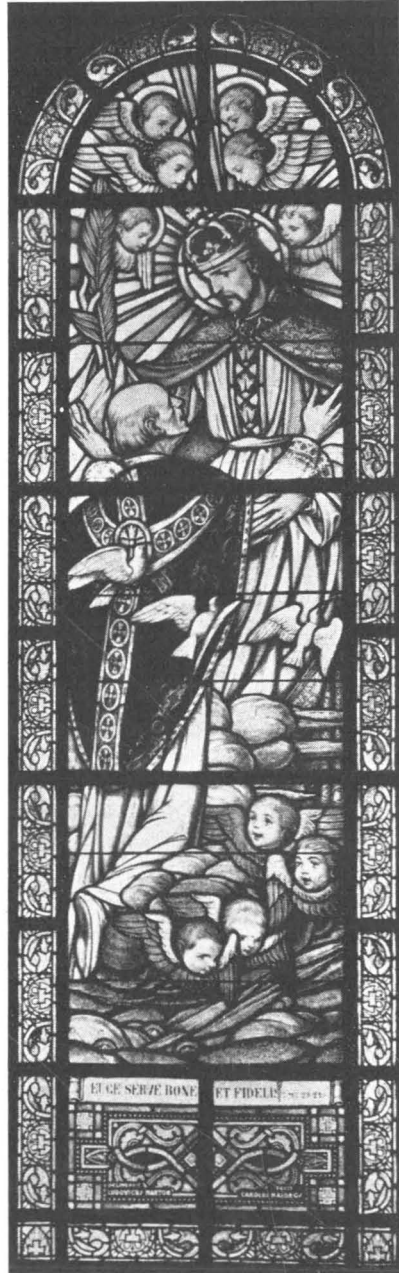
Az örök Atya trónjánál is maradj intézetünknek jóságos Atyja mindörökké!

Odaftent pedig: a megdicsőülés. Éppen egy esztendeje készült el a kápolna kilencedik, utolsó ablaka s ma már, ha áthull rajta az alkonyi fény, püspök Atyánk üzenetét halljuk onnan túlról: „Es állok a vakító fényözönben...” Mi pedig elstutogjuk százszor: